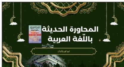
Gambar 1. Microsoft Power Point Dalam Pembelajaran Bahasa Arab

samping itu, metode ini memberikan dampak positif terhadap motivasi belajar santri, karena penyajian materi yang menarik dan interaktif mendorong mereka untuk lebih aktif berpartisipasi dalam proses pembelajaran. Oleh karena itu, metode pembelajaran berbasis Power Point dapat diklasifikasikan sebagai pendekatan yang efektif dalam meningkatkan maharah kalam, khususnya dalam konteks pengajaran Bahasa Arab di lingkungan pesantren yang menuntut pendekatan komunikatif dan kontekstual.